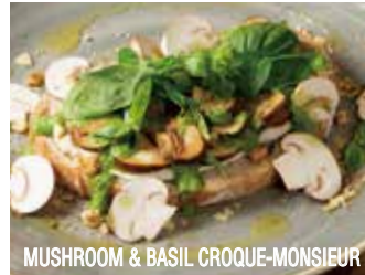
MUSHROOM & BASIL CROQUE-MONSIEUR

クリーミーマッシュルームとバジルの クロックムッシュ 1,590 (税込1,717)