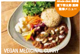
VEGAN MEDICINAL CURRY