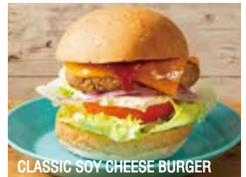
CLASSIC SOY CHEESE BURGER