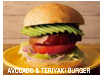
AVOCADO & TERIYAKI BURGER