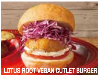
LOTUS ROOT VEGAN CUTLET BURGER