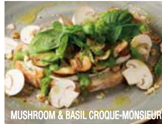
MUSHROOM & BASIL CROQUE-MONSIEUR

クリーミーマッシュルームとバジルの クロックムッシュ 1,590 (税込1,717)