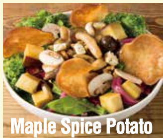
Maple Spice Potato