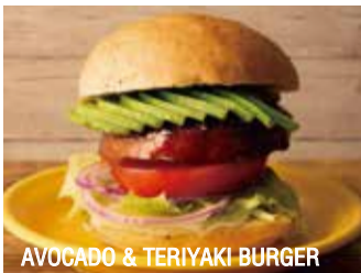
AVOCADO & TERIYAKI BURGER