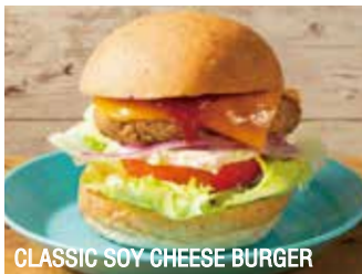
CLASSIC SOY CHEESE BURGER