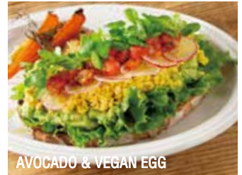
AVOCADO & VEGAN EGG

クリーミーマッシュルームとバジルの クロックムッシュ 1,590 (税込1,717)