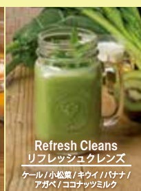
Refresh Cleans リフレッシュクレンズ

アップルマンゴー/ココナッツミルク/レモン アップル/マンゴー/ココナッツミルク/レモン アップル/マンゴー/ココナッツミルク/レモン