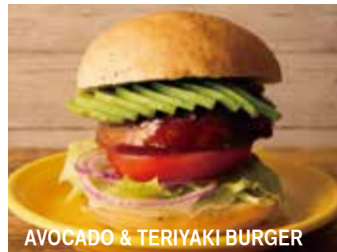
AVOCADO & TERIYAKI BURGER