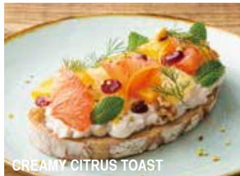
CREAMY CITRUS TOAST