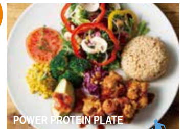
POWER PROTEIN PLATE