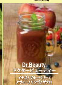
Dr.Beauty ドクタービューティー