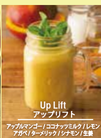
Up Lift アップリフト

バナナ/アボカド/カシューナッツ バナナ/小松菜/オーツミルク/ バナナ/アボカド/カシューナッツ