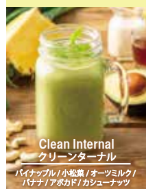
Clean Internal クリーンターナル

バナナ/アボカド/カシューナッツ バナナ/小松菜/オーツミルク/ バナナ/アボカド/カシューナッツ