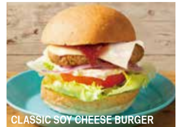
CLASSIC SOY CHEESE BURGER