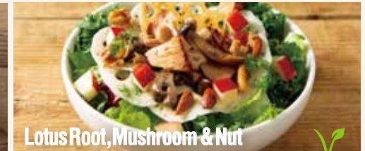
Lotus Root, Mushroom & Nut