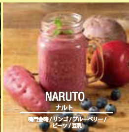
NARUTO ナルト 喉門金時 / リンゴ / ブルーベリー / ピーズ / 豆乳