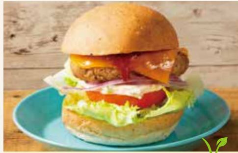
VEGAN BURGER / SOY CHEESE ヴィーガンバーガー / ソイチーズ 1,590 (税込1,717)

✓ VEGAN BURGER / TRUFFLE SOY CHEESE ヴィーガンバーガー / トリュフソイチーズ 1,890 (税込2,041)