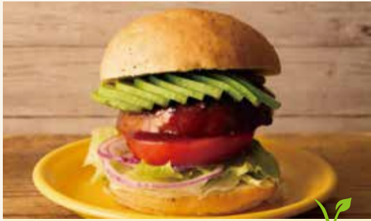
VEGAN BURGER / AVOCADO & TERIYAKI SAUCE ヴィーガンバーガー / アボカド & テリヤキソース 1,790 (税込1,933)

✓ Vegan…「ヴィーガン」とは植物性の食品のみをとる食生活の人 「肉・魚・卵・乳製品」を一切使用せず、新鮮な野菜と穀物などの植物性食材のみで作ったメニューです。