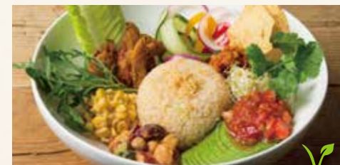
VEGAN TACO RICE ヴィーガントコロライス 1,690 (税込1,825)