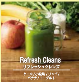
Refresh Cleans リフレッシュクレンズ ケール / 小松菜 / リンゴ / バナナ / ヨーグルト