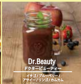
Dr. Beauty ドクタービューティー イチゴ / ブルーベリー / アサイー / リンゴ / カムカム