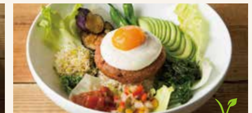
VEGAN LOCO MOCO ヴィーガンロコモコ 1,690 (税込1,825)