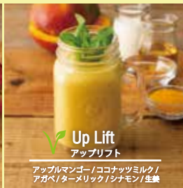
Up Lift アップリフト アップルマンゴー / ココナッツミルク / アガベ / ターメリック / シナモン / 生姜