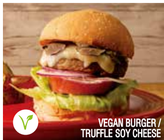
VEGAN BURGER / TRUFFLE SOY CHEESE

ヴィーガンバーガー アボカド & テリヤキソース 1,390 (税込1,501)