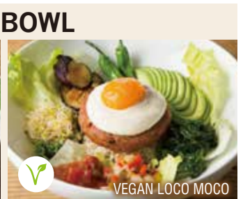
VEGAN LOCO MOCO