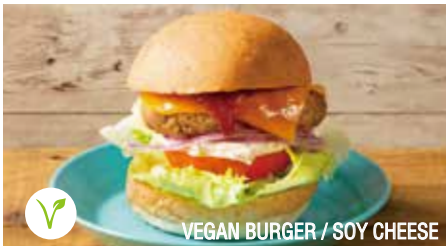
VEGAN BURGER / SOY CHEESE

Vegan ヴィーガンメニューについて... メニューの使用食材には動物性の成分を含んでおりませんが、当店では動物性食材自体の使用はございません。