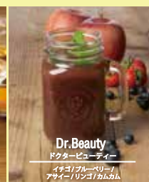
Dr. Beauty ドクタービューティー イチゴ / ブルーベリー / アイビー / リンゴ / カムカム