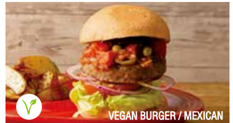
VEGAN BURGER / MEXICAN