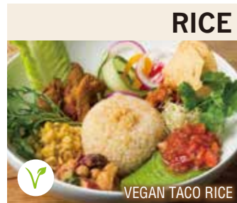
VEGAN TACO RICE