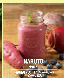
NARUTO ナルト バナナ / 小豆 / リンゴ / パナップ / ビーツ / 豆乳