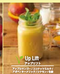
Up Lift アップリフト アップルマンゴ / ココナッツミルク / アガベ / タースリック / シナモン / 生姜