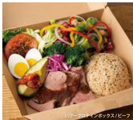
パワープロテインボックス / ビーフ

POWER PROTEIN BOX / BEEF パワープロテインボックス / ビーフ 1,990 (税込2,150)