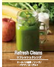
Refresh Cleans リフレッシュレングス ケール / 小豆 / リンゴ / パナップ / ヨーグルト

VEGGIE FULL SMOOTHIE ベジフルスムージー 各 790 (税込853)