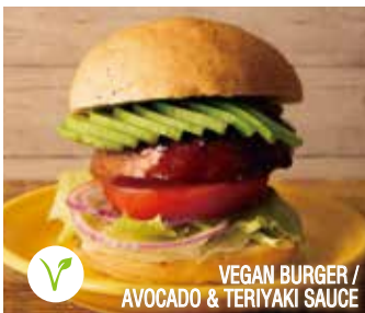
VEGAN BURGER / AVOCADO & TERIYAKI SAUCE

ヴィーガンバーガー アボカド & テリヤキソース 1,390 (税込1,501)