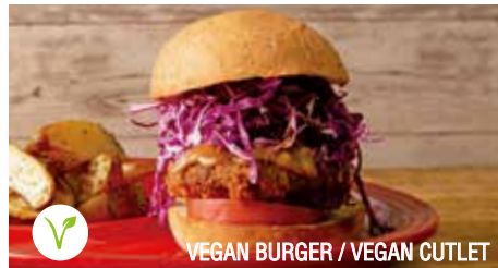
VEGAN BURGER / VEGAN CUTLET