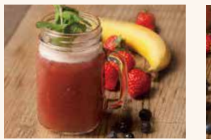
ドクタービューティー 690 イチゴ / ブルーベリー / アサイー / リンゴ