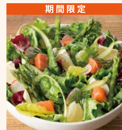
アスパラガスとスモークサーモントラウト 1,290

ロメインレタス / ケール / グリーンカール / トレビス / スプラウト / アボカド / 季節のグリーン野菜 / ライ ム / ヴィーガンジェノベーゼドレッシング