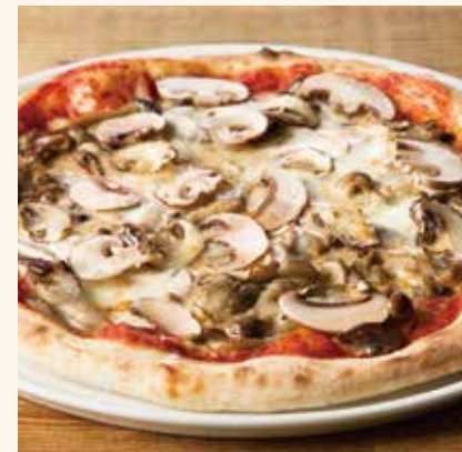
5種きのこの トマトソースピッツァ 1,490

カラフルトマト / モッツアレラチーズ / グラナパ ダーノチーズ / バジル / トマトソース