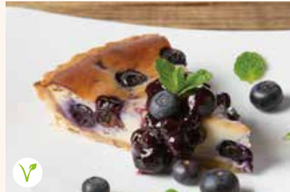
ブルーベリーのクラフティ 690