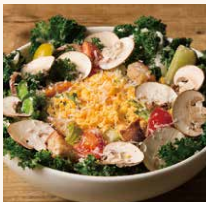
ケールとマッシュルームの シーザー 990

ロメインレタス / ケール / グリーンカール / トレビス / マッシュ ルーム / アンチョビ / ミモザ (ゆで玉子) / クルトン / トマト / ラ イム / ベコリー / チーズ / ホームメイドシーザードレッシング