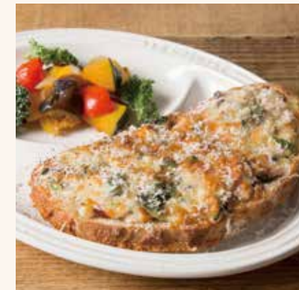
ほうれん草のクロックムッシュ 1,390

カンパニュ / ガーリックバター / ほうれん草 / オニオンソース / ペシャメルソース / ベーコン / ブラウンマッシュルーム / コーダ チーズ / チェダーチーズ / ベコリー / チーズ / カボナータ