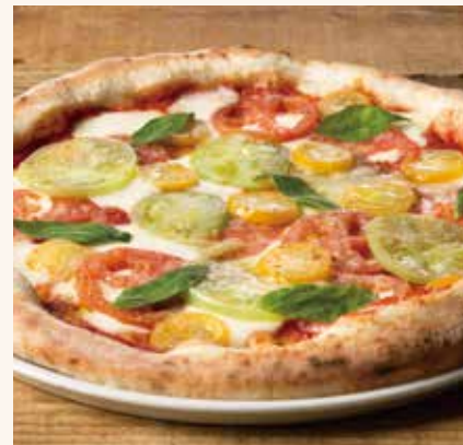
カラフルトマトのマルゲリータ 1,490

カラフルトマト / モッツアレラチーズ / グラナパ ダーノチーズ / バジル / トマトソース