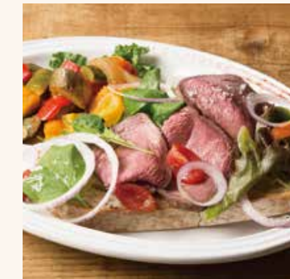
ローストビーフ&マスカルポーネ サンドウィッチ 1,490

カンパニュ / ガーリックバター / ほうれん草 / オニオンソース / ペシャメルソース / ベーコン / ブラウンマッシュルーム / コーダ チーズ / チェダーチーズ / ベコリー / チーズ / カボナータ