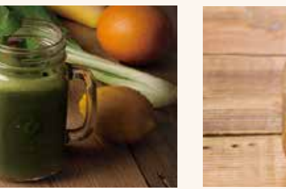
グリーンクレンズ 690 ケール / 小松菜 / オレンジ / バナナ / ヨーグルト / アガベ