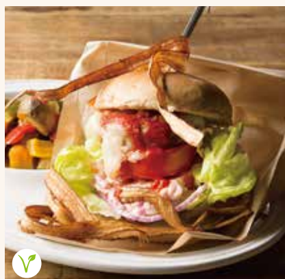
チーズ & ヴィーガンマスタード マヨネーズ 1,290

パンズ / ソイチーズ / ヴィーガンマスタードマヨネ ーズ / ヴィーガンタルタル / トマト / レタス / 大豆ミ ート / 赤玉ねぎ / カボナータ