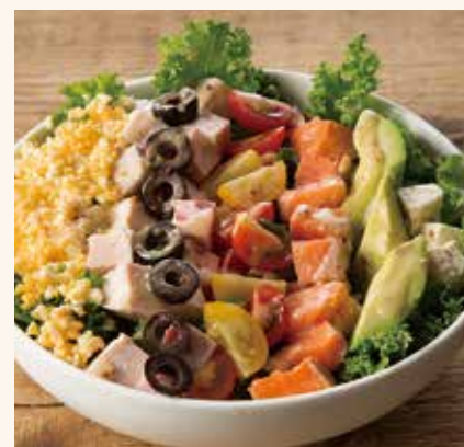
ファーマーズコブ 1,390

ロメインレタス / ケール / グリーンカール / トレビス / マッシュ ルーム / アンチョビ / ミモザ (ゆで玉子) / クルトン / トマト / ラ イム / ベコリー / チーズ / ホームメイドシーザードレッシング