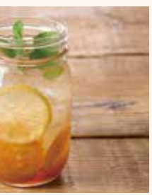
FARMER'S レモネード 590 (ICED)