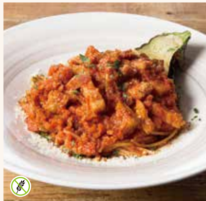
米なすのアマトリチャーナ 1,490