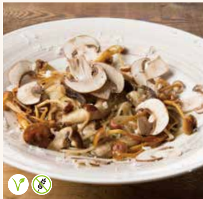
5種きのこのペペロンチーノ 1,390