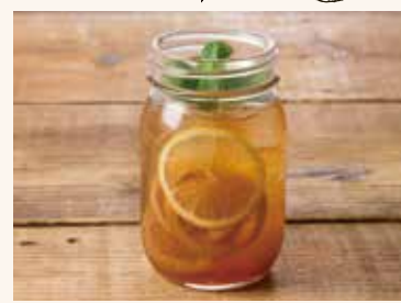
アールグレイレモネード 590 (ICED)