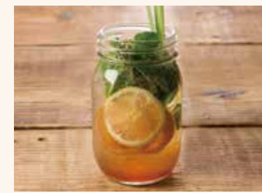
フレッシュハーブレモネード 690 (ICED)