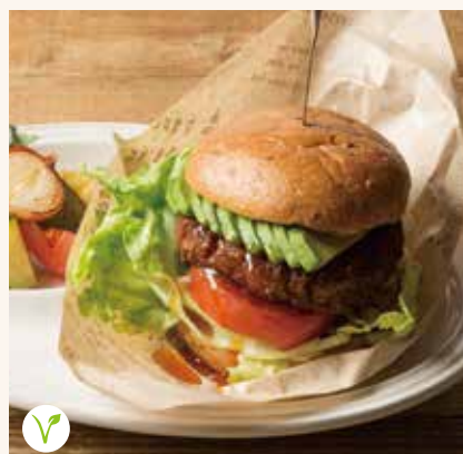
アボカド & テリヤキソース 1,390

パンズ / ソイチーズ / ヴィーガンマスタードマヨネ ーズ / ヴィーガンタルタル / トマト / レタス / 大豆ミ ート / 赤玉ねぎ / カボナータ