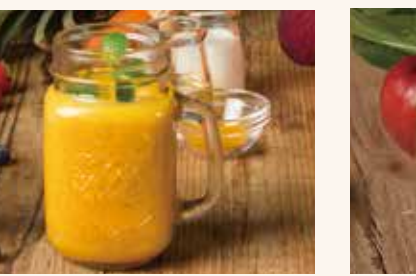
エナジーイエロー 690 人参 / 生薑 / ターメリック / タヒニ / バナナ / オレンジ / コナツツミルク