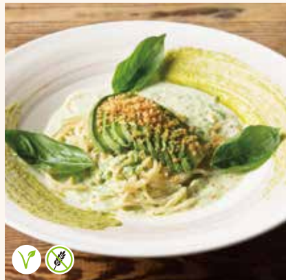
アボカドとキヌアのアーモンド ミルクソース 1,390