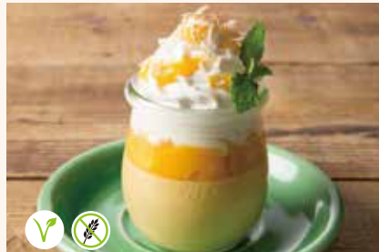
アーモンドミルクマンゴープリン 690